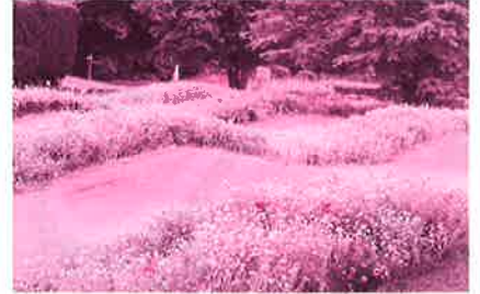
青・白・黒色 合計約1万株のネモフィラが咲き誇ります。