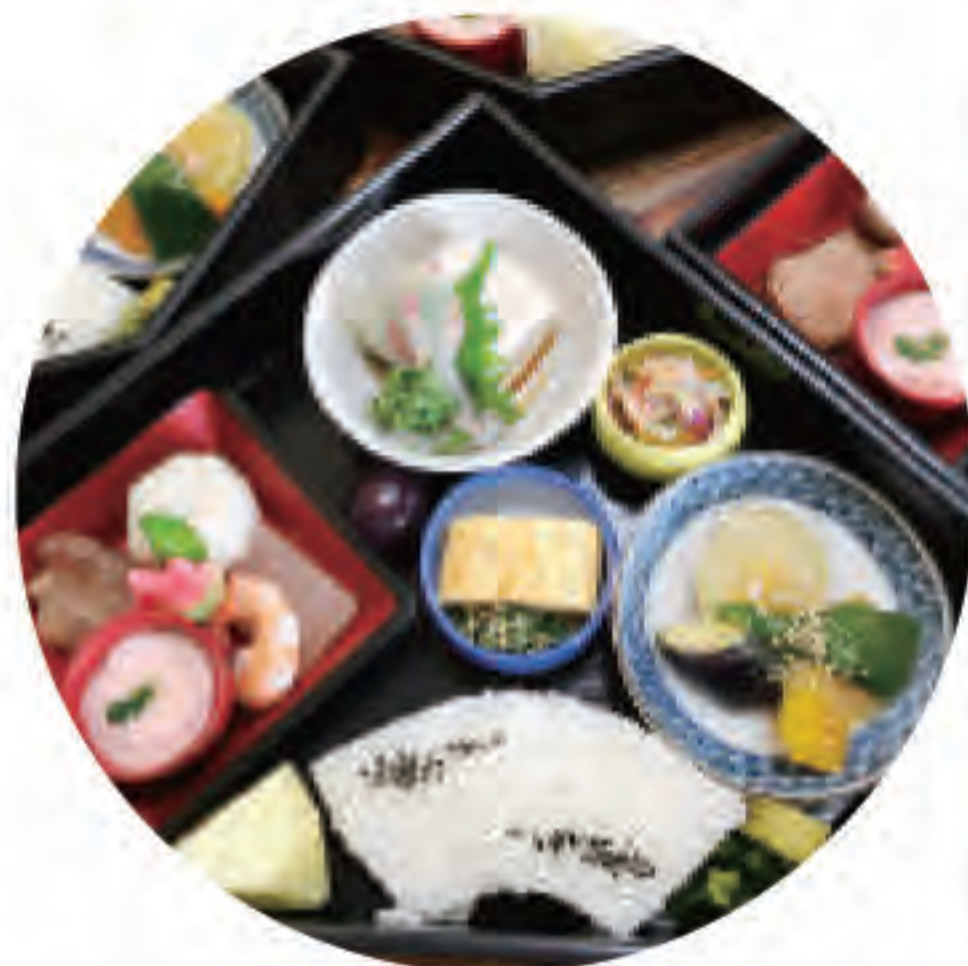
実際の献立とは異なりますので、 当日までお楽しみに。