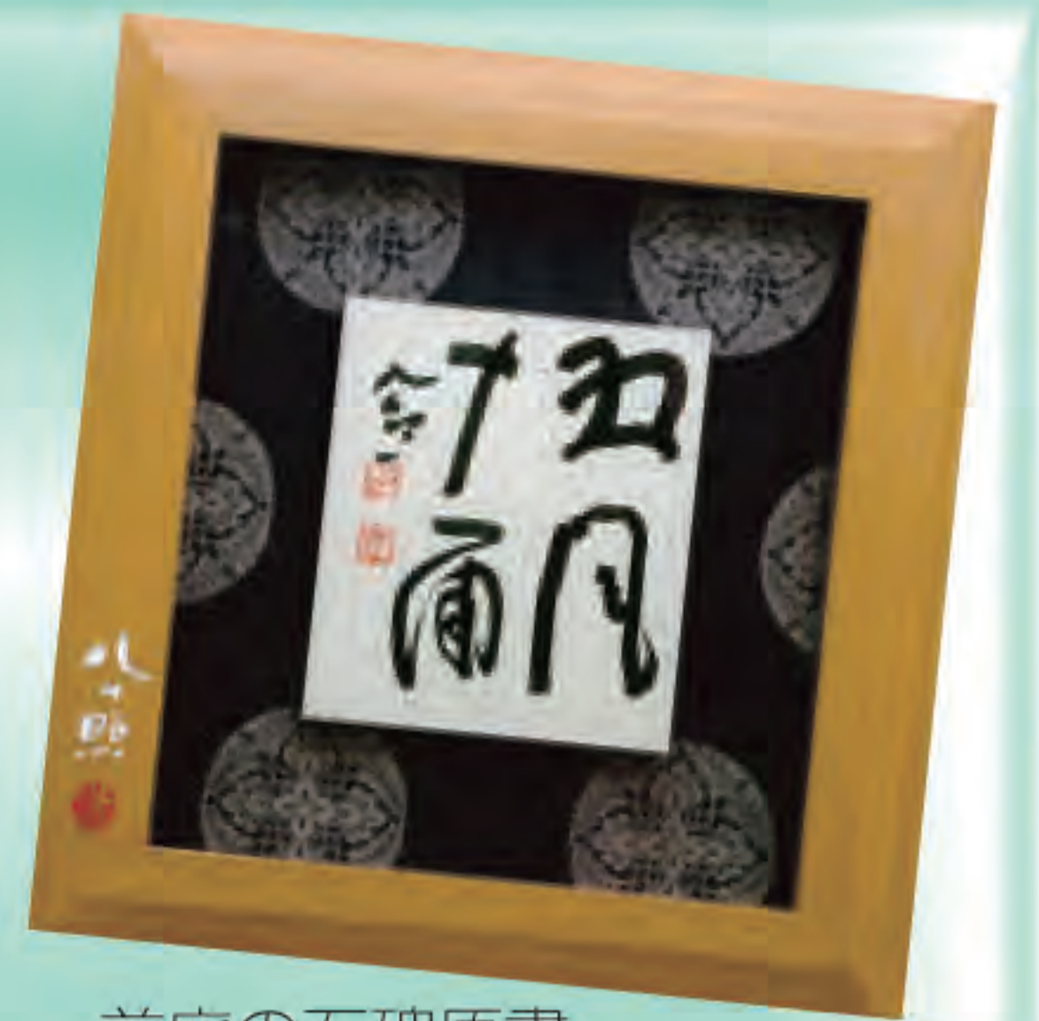
前庭の石碑原書 「五風十雨」清水公照墨書

当館は、自然豊かな書写山麓に宮脇檀設計の建物で平成6年（1994年）7月1日に開館し、今年で30年を迎えます。本展ではこれまでに収集した、姫路市生まれの奈良東大寺の僧侶・清水公照の関連作品、工芸(陶芸、染織、漆芸、金工、木工、皮革、ガラスなど)作品、土人形やはりこなどの全国の郷土玩具をあわせた2万3千点あまりの中から厳選した約100点で、作品に込められた雄弁な想いを紹介するとともに、歴代展覧会のポスターや、野鳥写真パネルなどで30年の歴史をたどります。