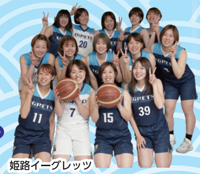
姫路イーグレッツ