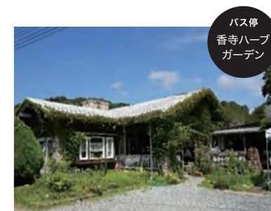
バス停 香寺ハーブ ガーデン