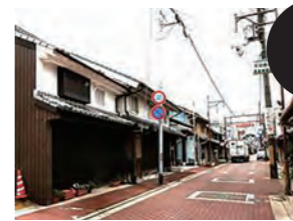
バス停 伊伝居 (野里)

豊臣秀吉、池田輝政の城下町割以来、商業・職人のまちとして、また但馬道の窓口として栄えた町です。今も虫庫窓籠窓のある伝統的な町屋が数多く見られます。