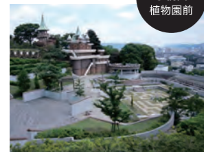
バス停 手柄山 植物園前

手柄山にある「手柄山中央公園」は、手柄山交流ステーション・緑の相談所・水族館・手柄山温室植物園・平和資料館が点在する総面積38ヘクタールのレジャースポット。秋に各施設にてイベントが開催される手柄山オータムフェスティバルは必見です。