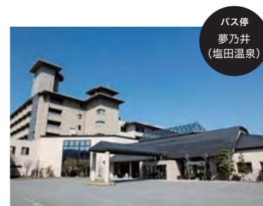
バス停 夢乃井 (塩田温泉)

姫路の奥座敷と呼ばれる温泉の歴史は古く、江戸時代には諸病に効くと評判になり、遠国からの湯治客でにぎわったと言います。ゆっくりとくつろげる自然豊かな環境が訪れる人々を出迎えてくれます。「上山旅館」を利用の方はこちらで下車。事前に連絡(☎079-336-0020)をすれば、バス停からの送迎が可能です。