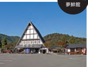
バス停 かまぼこ工房 夢鮮館

姫路市夢前町本327-16 ヤマサ蒲鉾株式会社本社内 ☎079-335-4800