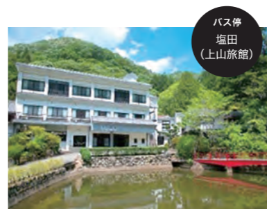
バス停 塩田 (上山旅館)

●入館料:無料 ●休園日:10月26日(火)、11月2日(火) ●問い合わせ:☎079-298-5571