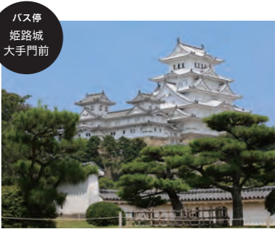
バス停 姫路城 大手門前

☎079-285-1146 ●料金 大人(18歳以上)…1,000円、小人(小学生、中学生、高校生)…300円 ●時間 開城9:00~17:00(最終入城16:00) ●休み 12月29、30日