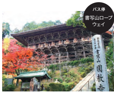
バス停 書写山ロープ ウェイ