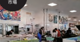
バス停 まえどれ 市場

恵み豊かな播磨灘で獲れた海の幸を坊勢漁協が直接販売しています。鮮魚の販売はもちろん、季節ごとの前獲れの魚介を使った食事を楽しめる大型フィッシュモールです。