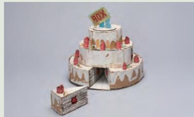
日比野克彦(WEDDING CAKE)1980年 岐阜県美術館

日比野克彦展「明日のアート」では、現在進行形のプロジェクトとともにこれらの「種」となった1980年代、1990年代の作品を紹介し、「アーティスト、日比野克彦」の全貌に迫ります。