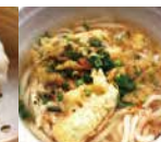
網干カキ天うどん