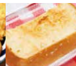
アーモンドトースト